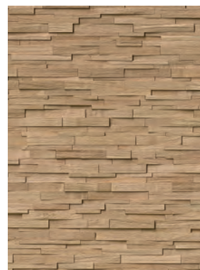
Spaltholz Eiche fein