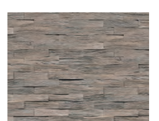
Spaltholz Eiche gealtert