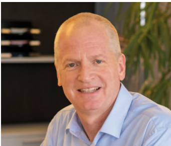
Roland Felder CEO/Delegierter des VR ANWR- GARANT SWISS AG & Aufsichtsrat SPORT 2000 International